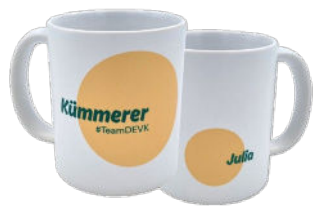
Werbeartikeleinkauf und -veredelung