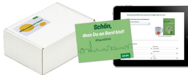
Individuelle Karten, Verpackungen und ggf. Landingpage