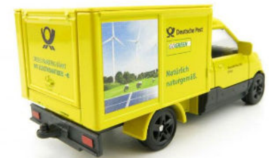
Konfektionierung und klimaneutraler Versand