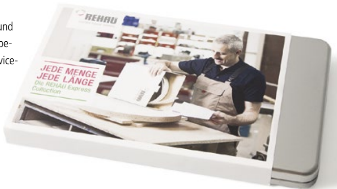
Die edle Geschenk-Box mit Banderole

Die inneren Werte waren einladend und klappbar.