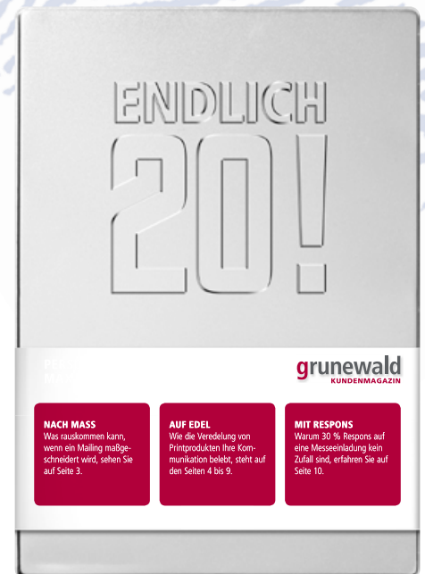
Die Titelseite: metallische Anmutung, Motto zum Anfassen

Das Anschreiben trumpft mit der außergewöhnlichen Kombination aus rotem Papier und weißer Druckfarbe auf. Weiße Druckfarbe mit Personalisierung? Genau, mit der neuen digitalen Technik bei grunewald leicht realisierbar.