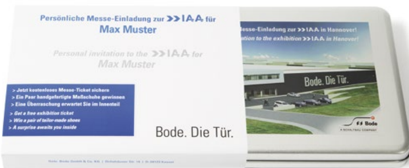
Das Mailing-in-the-Box: Auffällig, persönlich, unwiderstehlich ...

Mit einer variablen CrossMedia-Kampagne gelang der Gebr. Bode GmbH & Co. KG der perfekte Einstieg in die crossmediale Kundenkommunikation. Die Einladung zu 2 Fachmessen ging an 3 Zielgruppen – und erzielte bis zu 30 % Respons.