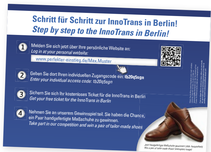
Auf direktem Weg: In 4 Schritten ging's zur Messe

Per automatisch generierter E-Mail bekam der Anmelder unmittelbar ein Bestätigungsschreiben nebst elektronischem Messeticket und Messeplan sowie sein personalisiertes Los für das Messe-Gewinnspiel. Der Vertrieb wurde in Echtzeit über alle Klicks jedes einzelnen Besuchers informiert – und wusste, wer wann zum Bode-Messestand kommt. Das ermöglichte die perfekte Vorbereitung.