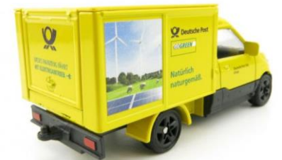
Konfektionierung und klimaneutraler Versand