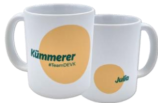
Werbeartikeleinkauf und -veredelung