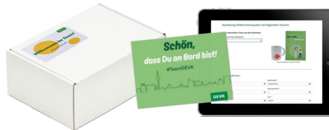
Individuelle Karten, Verpackungen und ggf. Landingpage